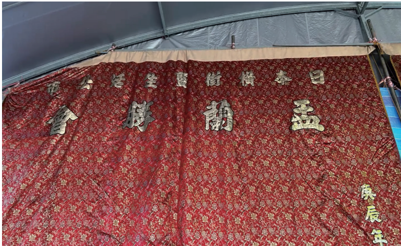
圖 2：2023 年 8 月分，筆者親赴檳城新街「生活公市」考察「萬景戲院」遺址時，適逢當地居民在舉行「孟蘭勝會」，背景大布條書「日本橫街暨生活公市」。