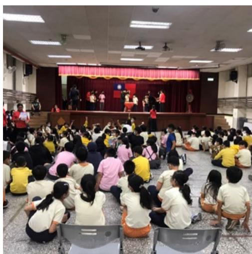
立人國小師生上台體驗戲曲武場打擊樂器