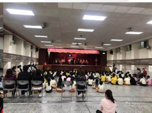
立人國小欣賞本系合奏演出