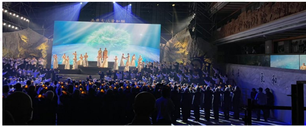
花蓮靜思堂演出現場

《靜》劇邀請諸多表演藝術團隊，包含明華園孫翠鳳與陳昭賢、臺灣豫劇團王海玲與劉建華，唐美雲歌仔戲劇團，優人神鼓等，舞台上動用近600名演員，本團有幸參與本世紀的宗教盛事之一。