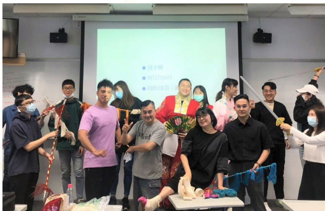
1100430 文化大學京劇講座