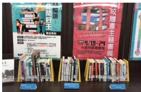
校慶週 - 愛校贈書主題書展

前傳藝中心主任暨前校長柯基良之夫人劉美貴女士贈送資料案—劉美貴女士將柯前校長多年於傳統藝術工作研究相關珍藏，贈送資料共計約70箱，圖書館將妥善運用人力編目加工上架供閱，豐富典藏嘉惠師生，歡迎至兩校區圖書館借閱利用！