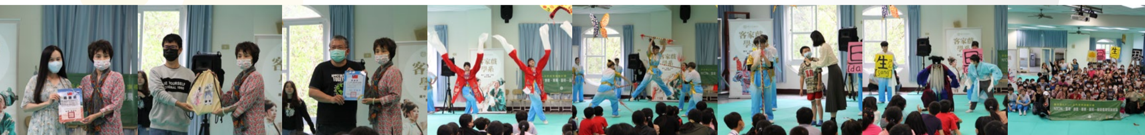
北山國小贈與感謝狀 贈與南港國小禮品 港源國小贈與感謝狀 水袖表演 出手槍演出 與小朋友互動 小朋友穿水袖體驗戲曲身段 大合照