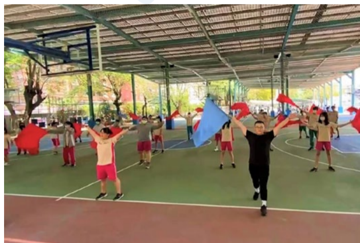
1100408 高雄市五甲國中雜耍(小旗)體驗課程