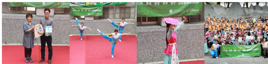
互贈感謝狀與禮品 三功展現 《杏花巡醫》表演八角巾 大合照