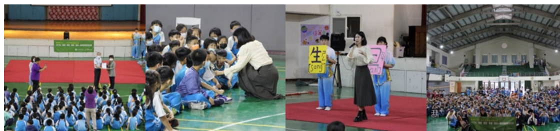
贈與感謝狀 主持人與觀眾互動 主持人介紹戲曲行當 大合照