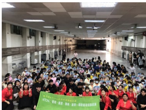
本系學生與立人國小參與計畫師生合影