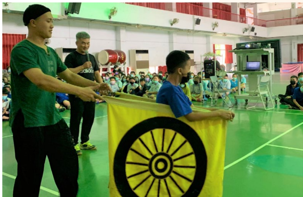
1100504 彰化花壇小京劇講座