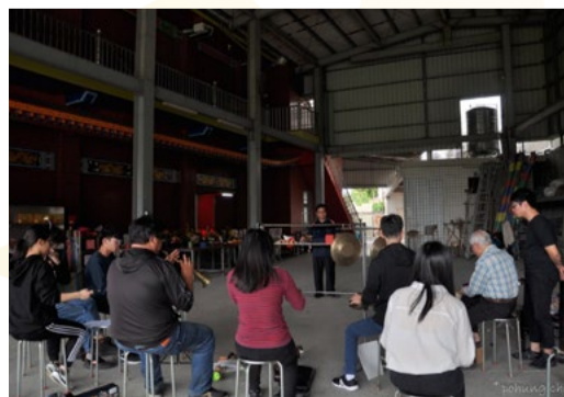
後場音樂搭配前場戲偶活奏練習