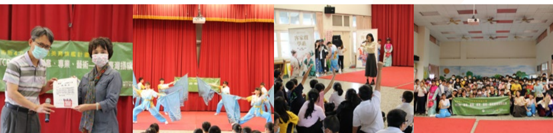
贈與感謝狀 大旗演出 有獎徵答活動 大合照