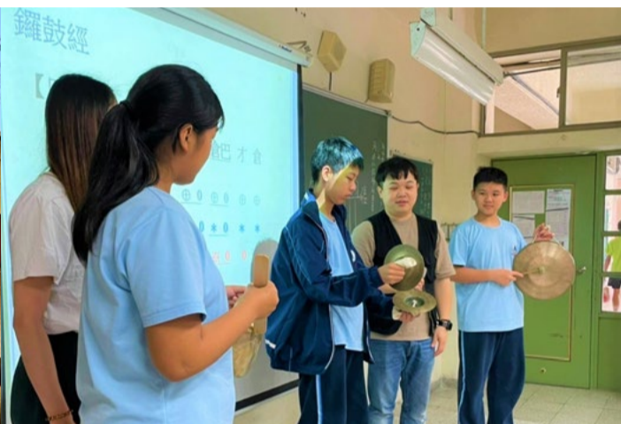
1100506 新北市青山國中戲曲音樂體驗課程