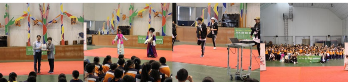
贈與感謝狀 演出《杏花巡醫》 街舞表演 大合照