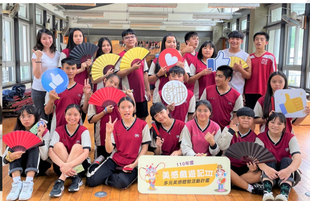
1100508 南投民和國中戲曲舞蹈講座