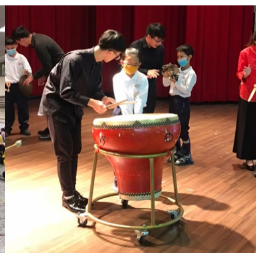
由本系學生引導光復國小的學生體驗武場打擊樂器