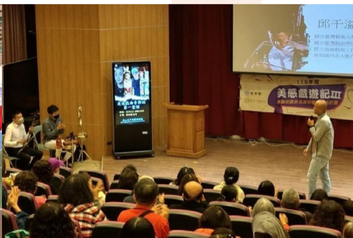
1100414 海山高中進修部戲曲音樂講座