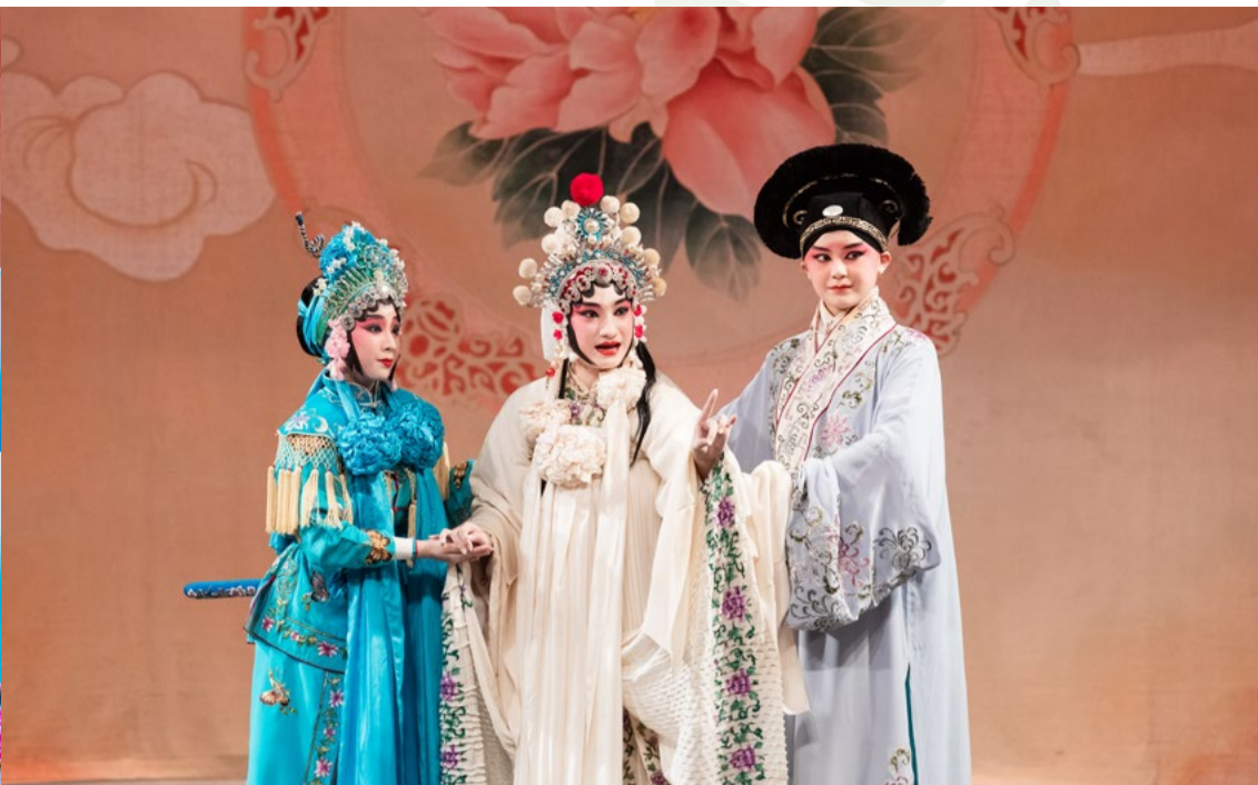
白蛇傳 - 斷橋