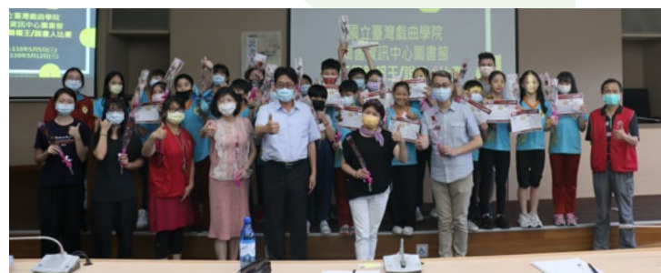
說書人簡報王比賽合照

110年5月12日於戲曲樓9樓舉辦「第二屆說書人及簡報王」比賽，高職簡報王共計10組11人次參加；說書人國中組計10組16人次參加；說書人國小組計10組17人次參加，共計30組44人次。