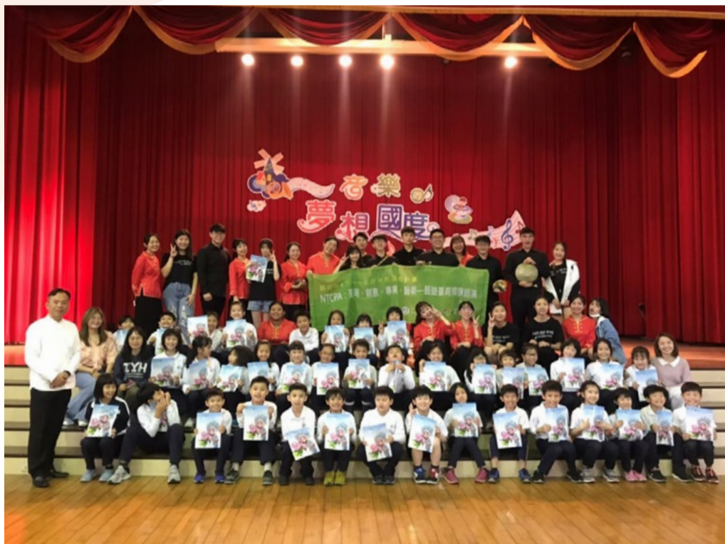
本系學生與光復國小參與計畫師生合影

戲曲音樂學系辦理 110 年藝術新 4 力計畫，赴台中光復國小、立人國小插旗演出。這兩所學校師生對於戲曲音樂表演，均持有極高興趣，對於戲曲文場與武場音樂有近距離的接觸，特別是武場打擊樂器實務操作，兩校的學生親自加入學習，與本系學生互動熱烈，雙方都有很豐富的收穫，兩校師生期待將來有機會與我們再相見！