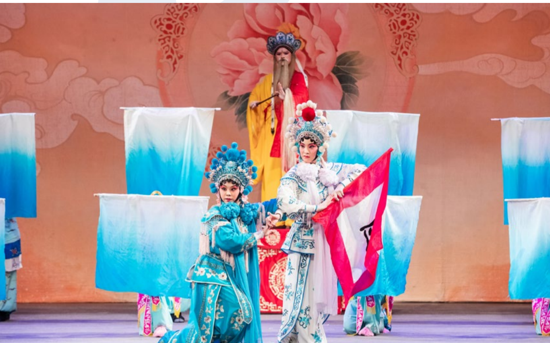
白蛇傳 - 水漫金山