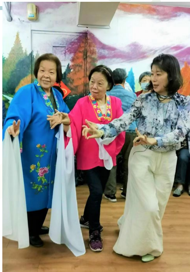
1100417 忠順里歌仔戲講座

活動由北至南，由東向西的巡迴在全臺灣各地，四月中旬受颱風舒力基外圍環流影響，導致當時正赴蘭嶼辦理活動的船班因海象惡劣在海上拋錨，拋錨事件還上了新聞，幸而一行人虛驚一場平安歸來。蘭嶼的海洋傳藝活動因此改期至六月中旬，誰料疫情自五月中旬進入三級警戒，至今（六月底）的活動被迫宣布停辦以維護彼此的健康與安全。希望好事總是多磨，也期待疫情在台灣逐漸獲得趨緩，下半年美感教育前線，我們一定不缺席，一記好球準備再次投出，讓戲曲傳藝美名永傳揚。