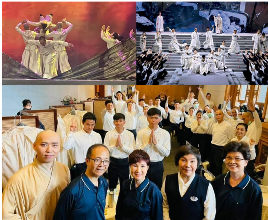
花蓮靜思堂「法華經」演出地點

主題要呈現人間菩薩道的精神，也是慈濟一路走來的理念。除了手語演繹，透過戲劇、唱誦、以及擊鼓的過程，引領大眾，用方便法走入經藏。