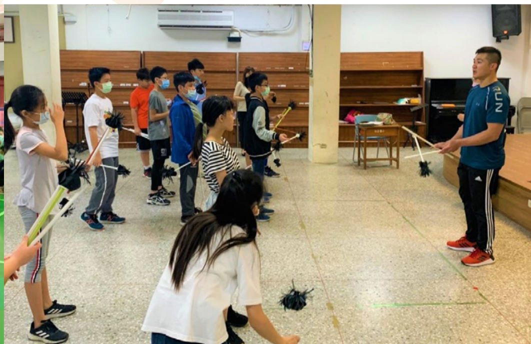
1100426 新竹市竹蓮國小雜耍一體驗課程