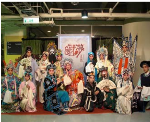
學生粉墨登場搭配江蕙戲夢演唱會開場曲《月落》演出