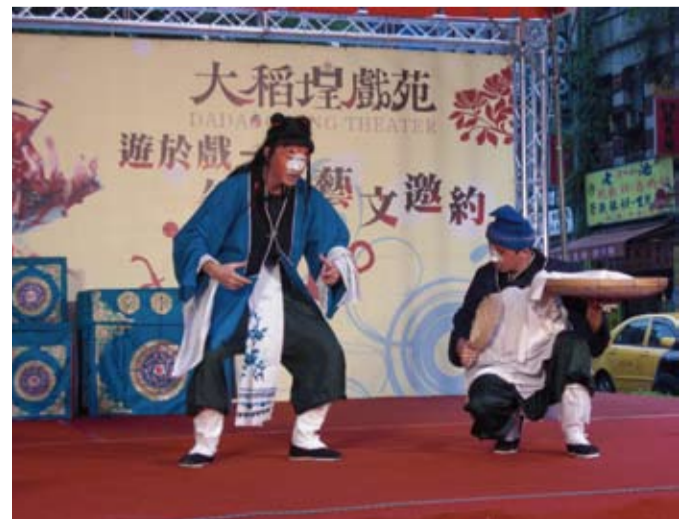
99.10.2 大稻埕戲苑《遊街》演出