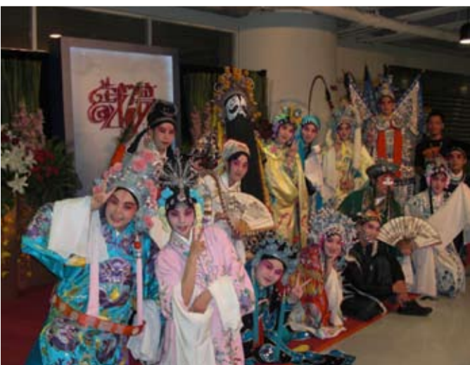
京劇學系參與台北場演出合影