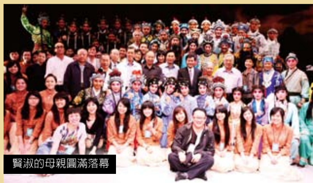
賢淑的母親圓滿落幕