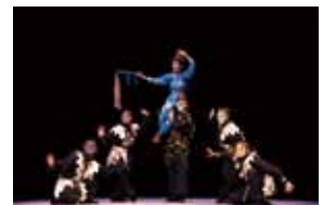
《盜庫銀》：青蛇為拯救百姓，盜取貪官銀兩。