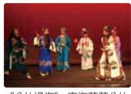
《八仙過海》：東海蓬萊八仙齊聚，相約前往蟠桃盛會。