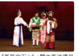
《高風豹下山》：關主高洪遣其子高風豹攜隱身草、烏鴉寶前往西河，搭救胡氏一家。