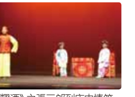
《糶酒》之張三到店中情節。