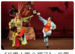
《岳雲大戰金彈子》：岳雲領命戰金彈子。