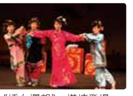
《嬌女選親》：媒姨登場，花言巧語對嬌女說媒。