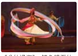
《八仙過海》：鯉魚精至仙島遊賞風光。