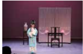
余賽花思念楊繼業。