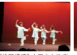
《桃花過渡》之四少女洗衣情節。