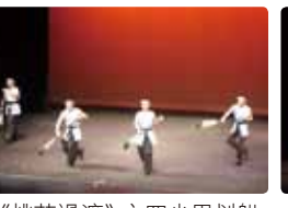
《桃花過渡》之四少男划船情節。