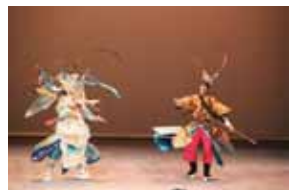
楊繼業與崔龍開戰。