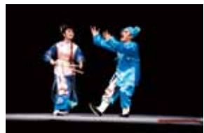
楊洪和小蓮鬥嘴打鬧。