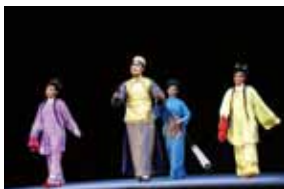
《鬧渡》：花少爺在船上調戲兩位姑娘，幸有撐船大姑的義助。