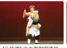
《公揆婆》之夫妻對唱情節。