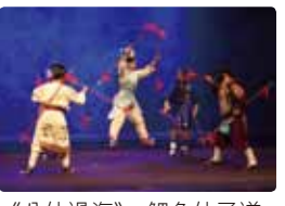
《八仙過海》：鯉魚仙子遂與蓬萊八仙較量法術。