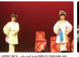
《糶酒》之姊妹開店門情節。