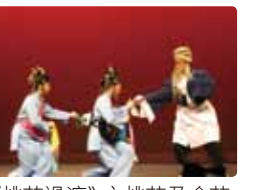
《桃花過渡》之桃花及金花上船情節。