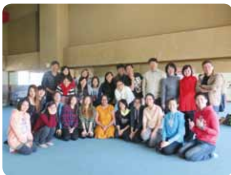
印度古典與客家傳統的相遇