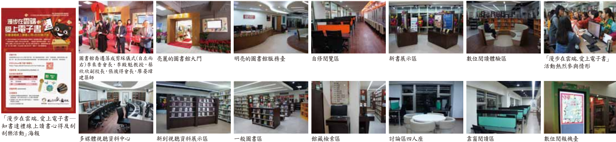
「漫步在雲端，愛上電子書——知書達禮線上讀書心得及刮刮樂活動」海報