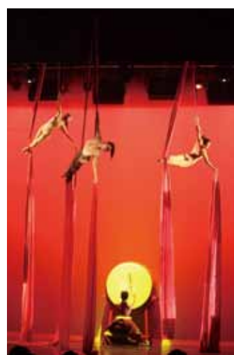
民俗技藝學系-秋風辭(網吊)