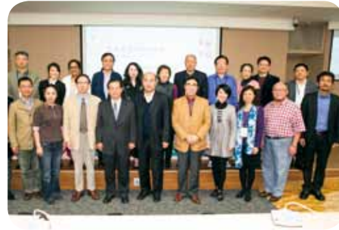
座談會與會人員合影

本校作為全國唯一的傳統戲曲高等學府，肩負戲曲傳承發揚之重任，於戲曲研究方面，更無推托餘地。因此，在過去幾年，本校每年都盛大辦理國內最具規模的戲曲國際學術研討會，邀請海內外專家學者共同出席，分享交流研究成果。2013年的戲曲國際學術研討會，以「傳統表演藝術教育的研析與展望」為主題，於去年11月29-30日期間，辦理論壇及相關研討活動。