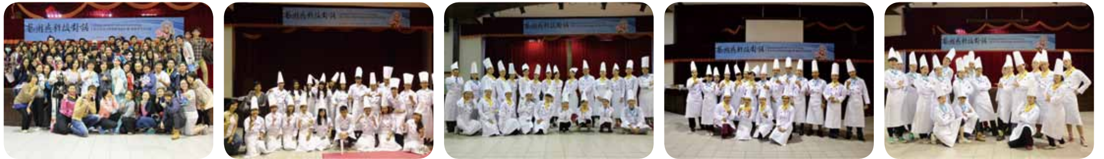
「容妝造型體驗課程」後兩校師生大合照 「民俗技藝體驗課程」戲曲學院師生合照 「歌仔戲身段體驗課程」戲曲學院師生合照 「京劇身段體驗課程」戲曲學院師生合照 「容妝造型體驗課程」戲曲學院師生合照

兩校共同辦理「藝術與科技對話」活動，主要目的在於提升兩校學生學習動機、藝文鑑賞與多元文化之學習能力，並同時推廣兩校發展特色課程，深化學生接觸不同領域的學習與體驗，激盪出跨校跨領域雙向交流與合作關係，希冀未來能持續推廣兩校之特色課程跨域結盟，未來能成為定期性的交流活動，開啟學生心中藝術與科技的對話。