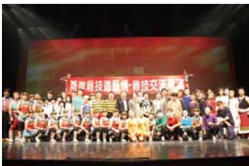
兩岸演出人員合影