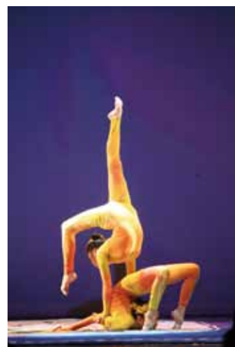
民俗技藝學系-幻影(丟棒)