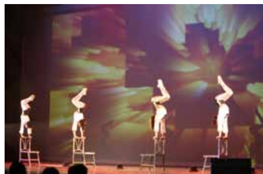
大連雜技團-椅子頂