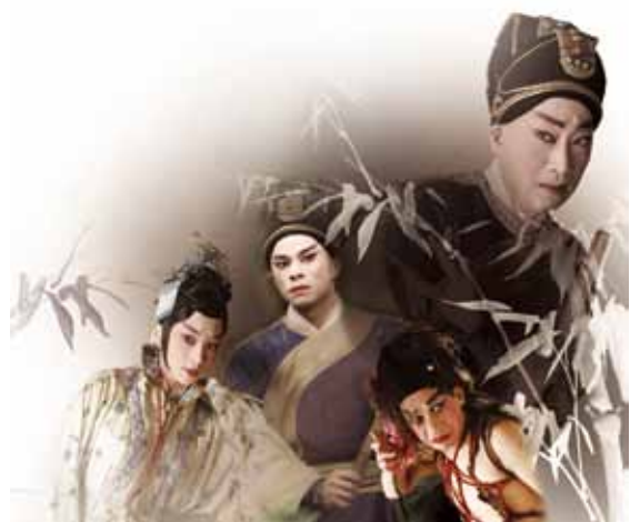
書法題字/楚戈