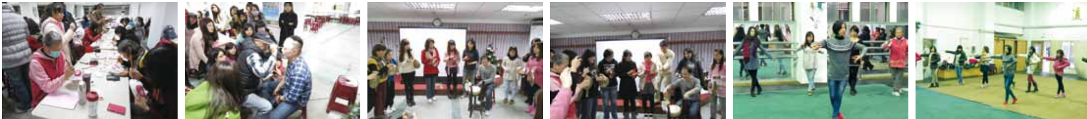
「生旦淨丑、彩繪勾勒」