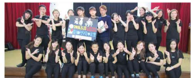
▲ 105.03.16 戲曲音樂學系至高雄樹德家商招生演出