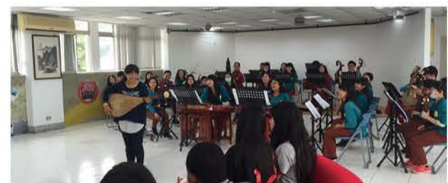
▲ 105.04.01 加州柏克萊學校與戲曲音樂學系交流活動