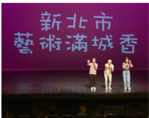
主持人：以生動活潑的方式帶領小朋友學習劇場禮儀，為培養未來觀眾素養，奠定良好的基礎

99 年起新北市主辦的藝術滿城香活動，已堂堂邁入第 10 個年頭，藝文中心自 105 年起接辦，肩負起校內演藝團體與教育當局之媒合與推介工作，使本校表演團體及學系的優秀演出得以聲名遠播。活動創辦的主要目的在於培養國小四年級學生對於傳統劇藝的欣賞興趣，使學生沉浸於表演藝術氛圍的同時，也體驗到劇場禮儀的形塑，以及戲曲文化的紮實傳承。