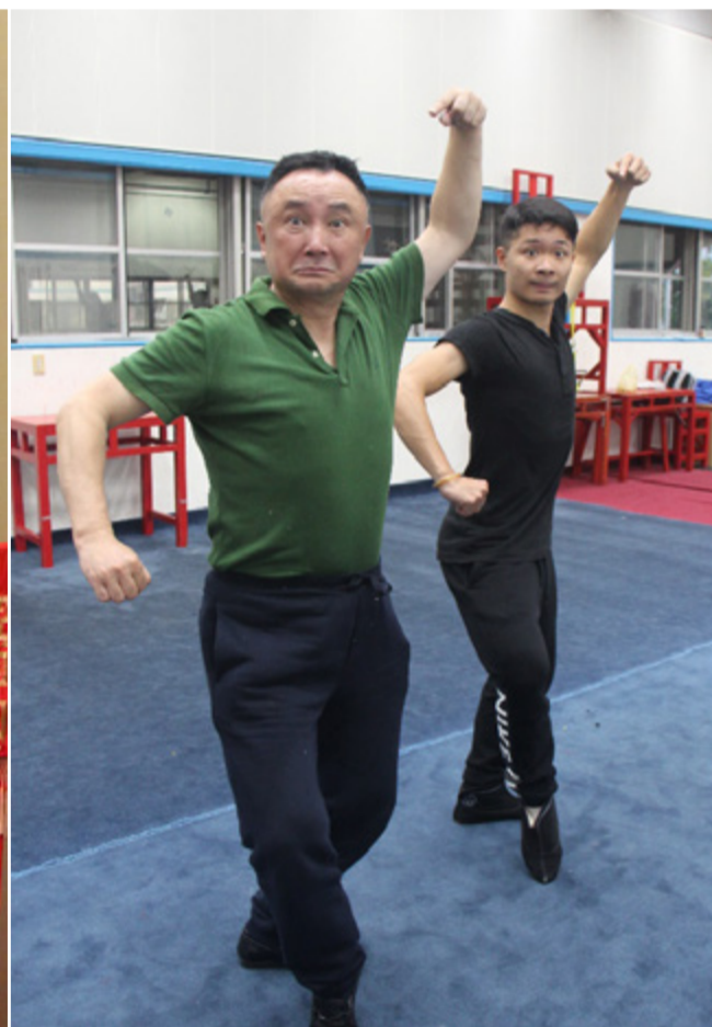
石老師帶領徒弟，排練三盜九龍杯