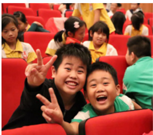
沙崙國小小朋友首次進入劇場觀賞藝術表演

108 學年度本校承接新北市政府教育局委辦之藝術滿城香活動，已於 108 年 11 月 25 日在木柵演藝中心完成最終場演出，一個多月的歡樂、忙碌與激情，在小觀眾們滿足的歡笑與驚嘆聲中，畫下圓滿的休止符。