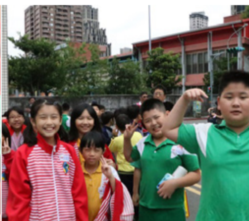
溪洲國小小朋友入校園情景

99 年起新北市主辦的藝術滿城香活動，已堂堂邁入第 10 個年頭，藝文中心自 105 年起接辦，肩負起校內演藝團體與教育當局之媒合與推介工作，使本校表演團體及學系的優秀演出得以聲名遠播。活動創辦的主要目的在於培養國小四年級學生對於傳統劇藝的欣賞興趣，使學生沉浸於表演藝術氛圍的同時，也體驗到劇場禮儀的形塑，以及戲曲文化的紮實傳承。