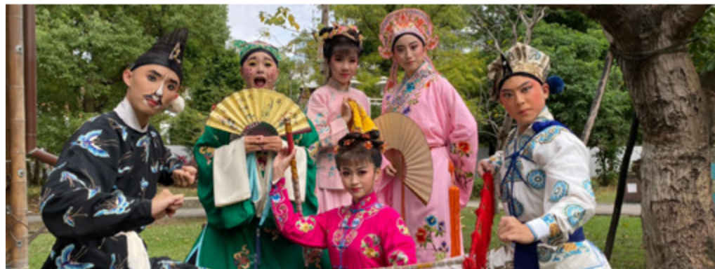
11月23日行當展示表演