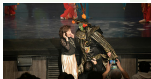
教育部技職司楊玉惠司長蒞臨會場與演員互動

由於迴響熱烈，今年度 11 月 11 日於木柵演藝中心舉行的第六場演出，更邀請教育部技職司楊玉惠司長、本校大家長劉晉立校長，以及滿場 5 百多位小朋友共同經歷一場視覺上的奇幻冒險。楊司長除了全場參與觀賞之外，更親切與特技團演員進行互動，給予我們實際的支持與滿滿的能量。