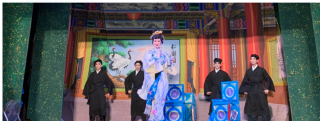
11月21日《金春醉酒》演出

為在有限時間內製作收冬戲，本系於教學規劃整合了「主修」、「副修」、「實習演出」、「畢業製作」、「客家戲基礎唱腔」等課程與師資，將收冬戲之教學、演練與實習展演結合為一，並進行跨年級之教學與鍛鍊，動員全系之力成就收冬戲的展演。在經費挹注下，使本系培訓的表演藝術人才能有展演機會，使一般大眾更了解傳統客家戲曲。