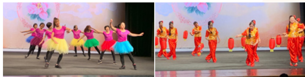
樂活瑜珈班成果表演