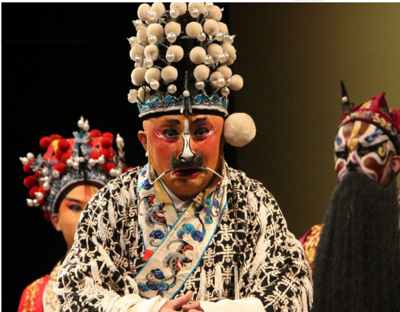
石老師示範演出，飾演文場楊香武

會後並召開演出座談會，期盼藉由本次教育部高教深耕之明師工作坊計畫，弘揚京劇藝術以求永續傳承。