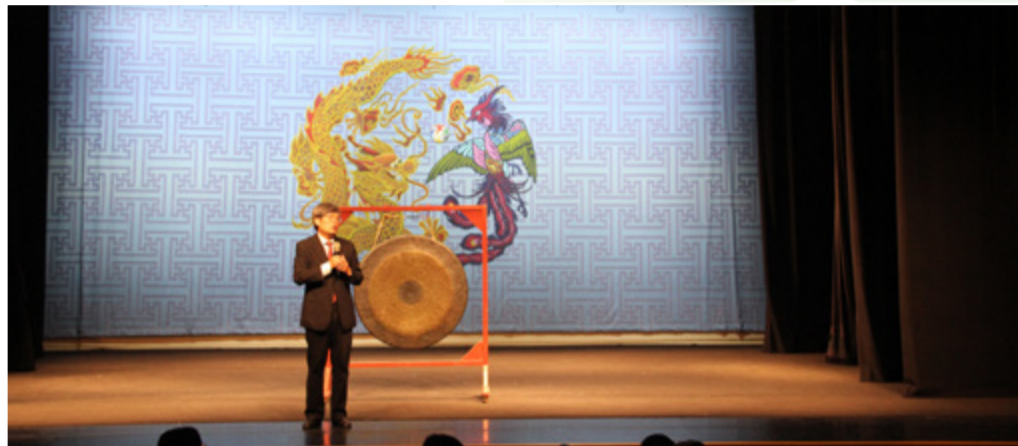
成年禮副校長致詞

接著在成年儀典中，以鞠躬擁抱感謝師長，在求學路上，無私付出，陪伴大家一同成長，通過師長授紀念印章，引領學生們正式邁入人生的新里程，最後全體高三生高聲宣示，自己會竭盡所能成為一個術德兼備的有品戲曲人。