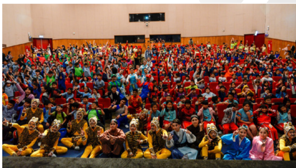
全體演員與小朋友拍照合影