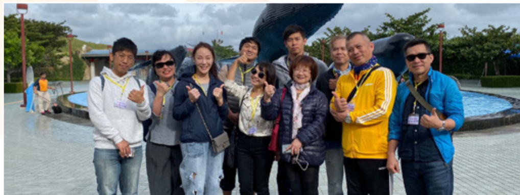
畢業旅行師長合照