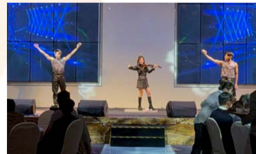
小提琴演奏與彈球表演