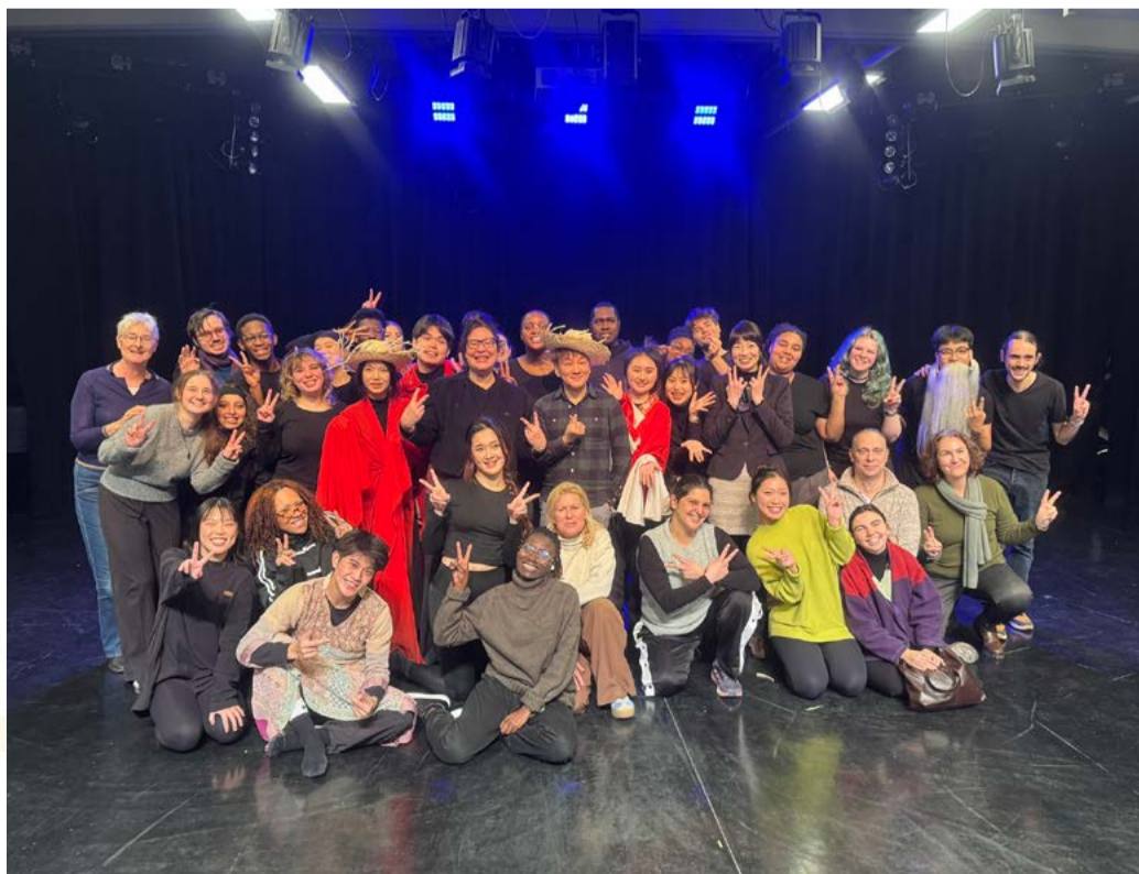
115年本校赴姊妹校法國巴黎第八大學短期交流合照

此次法國巴黎第八大學課程以民族戲劇學為開端，分為聲音工作坊與面具工作坊。聲音工作坊部分，Marcus老師藉由練習，促使學生感受聲音的頻率、高低、起伏與音量，並強調如何擺放發聲的共鳴位置。也教導學生暖身練習，諸如將雙手搓熱，再觸碰臉頰，藉由這樣的動作來打開身體的感官。另外還有「即興