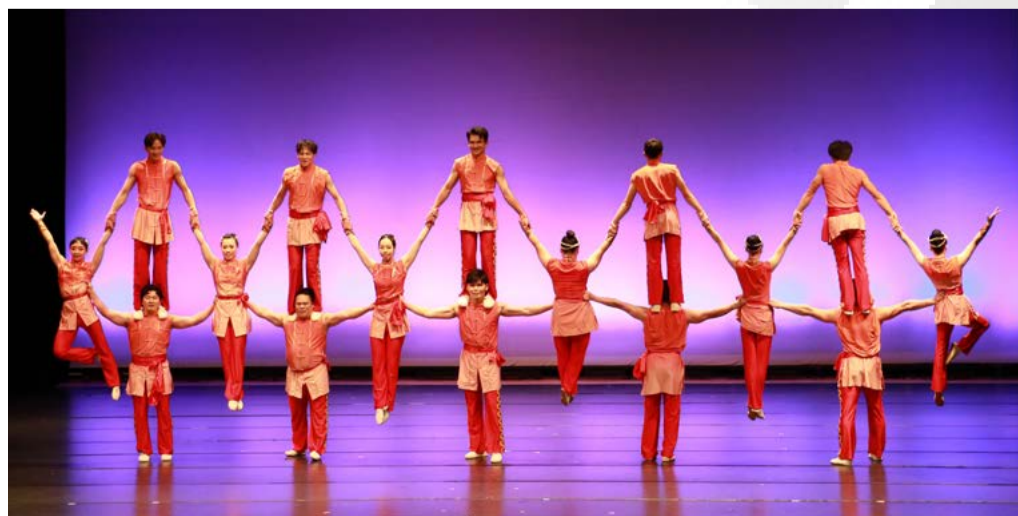
疊羅漢 - 呈現力與美的技巧

穩定控制；而《吉祥如意旺一年》(板凳造型) 與《平衡納福轉運來》(晃管) 等高難度節目，則結合力量與平衡之美，演員們以長年累積的專業訓練與默契合作，在舞台上展現出精準、穩定而優雅的動作，每一個翻轉、每一次平衡，都讓觀眾屏息以待，隨後報以熱烈掌聲。透過這場充滿活力與藝術魅力的表演，臺灣特技團不僅帶來一場難忘的視覺饗宴，也讓全校師生在歡樂的氣氛中迎接新年的到來。