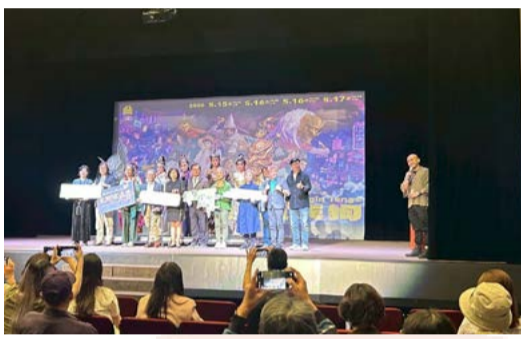
115年3月24日臺灣戲曲藝術節記者會

《金銀天狗》以清朝雍正年間為背景，圍繞一對性格截然不同的姊妹，玉蟬與素秋展開。姊姊玉蟬純良溫柔，妹妹素秋則狡猾狠毒，兩人同時戀上英俊的楊玉郎，掀起一連串愛恨交織。劇情涵蓋動人的兒女私情、更交織了宮廷鬥爭、忠義與背叛等宏大主題，戲劇張力滿滿。