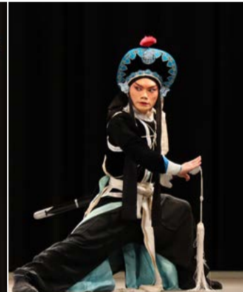
《林沖夜奔》精彩片段