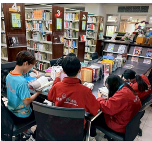
在老師的帶領下，於課堂借書寫心得的認真背影

被譽為「華文出版界的奧斯卡」的 openbook 好書獎，會在每年度 12 月公布得獎書單。為順應最新知識與社會趨勢、活絡館藏資源，圖書館於 115 年初即辦理 2026 一馬當先—OPENBOOK 好書賞新春閱讀福袋活動，嚴選 2025 Openbook 入圍與得獎之「年度中文創作」、「年度翻譯書」、「年度童書」、「年度青少年圖書」、「年度生活書」5 大主題優質圖書，並加碼購進新進 114 年度好書。