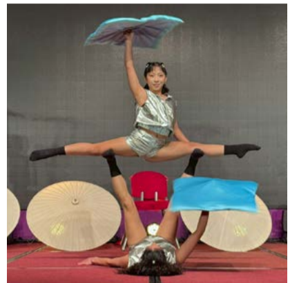
技藝高超的雙人疊羅漢轉毯