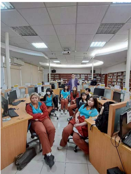
圖書影視研習社 - 圖書影視研習社歡迎您！

社團活動地點在木柵圖書館，時間於 115 年 2 月 23 日至 6 月 24 日後每週三 14:20-16:10。邀請有興趣的同學、志工一起學習。