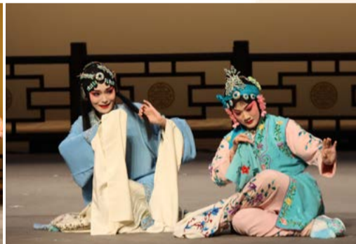
《失子驚瘋》精彩片段