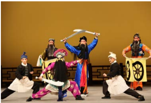
《七雄聚義》精彩片段

京劇學系大四班畢業展演於 115 年 01 月 03 日在木柵校區表藝館演出，演出經典折子戲《七雄聚義》《春草闖堂》《失子驚瘋》《鋸大缸》