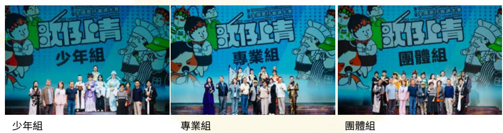
少年組 專業組 團體組