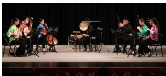
團體組由客家組以《客家戲音樂連奏》奪冠