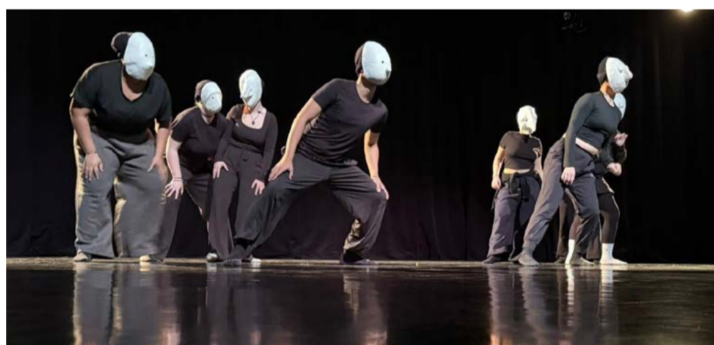
成果發表面具總彩排

podcast」的練習，要即時創造一種不存在的語言，來達成一段包含衝突與結尾的對話。有學生反映這樣的練習讓他意識到他在表演時心裡過度執著於達到「正確」表現，反而會有尷尬的停頓與僵硬。