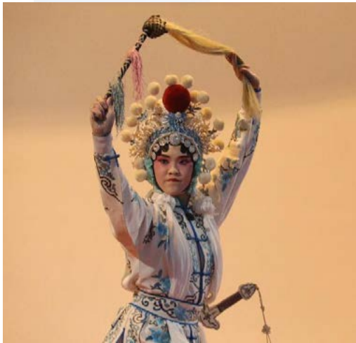
演出劇目：水漫金山