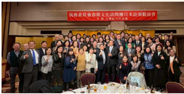
日本橫濱臺灣駐日代表周學佑公使（中間）及中華聯合總會餐聚合影及中華聯合總會餐聚合影

此次節目創作以「傳統精神、現代精緻」為創作核心，融合現代舞蹈美學、悠揚小提琴的旋律及影像敘述故事設計等創作產出了《島嶼流光·藝動臺灣》作品，呈現臺灣這座島嶼的歷史長河閃耀光芒，以文化藝術感動世界。節目內容設計以東方上古文化「四象」——青龍、白虎、朱雀、玄武為創作主軸，象徵東、西、南、北四方能量，為農曆春節帶來吉祥平安之意。訪問團12位演員以精湛身手，在2位技術老師的燈光視覺與磅薄音樂及服裝設計的烘托下展現緊湊節奏、高難度技巧、美麗畫面，令現場座無虛席的觀眾驚嘆連連，令人倍感驕傲。