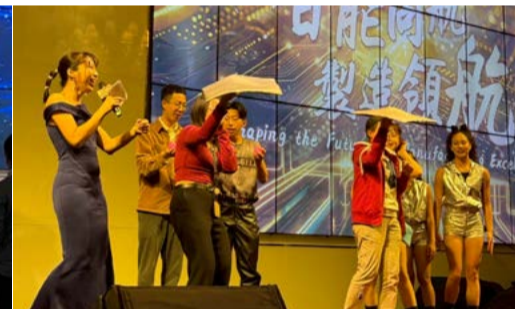
尾牙演出互動現場