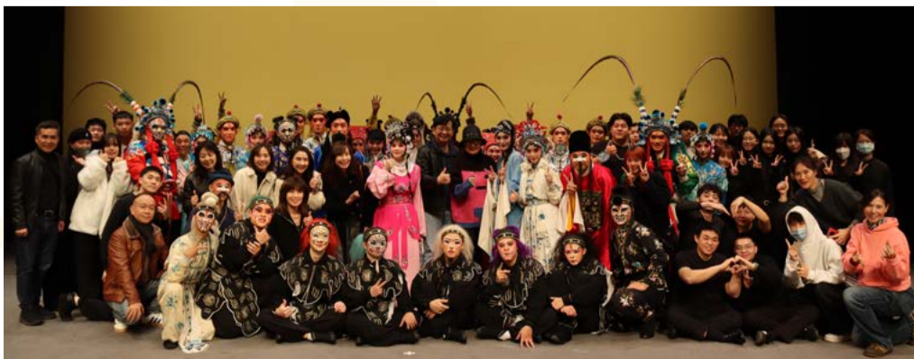
大四畢業班全體合影