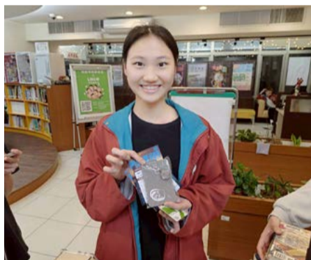
完成任務，成功領取馬年限定套卡

新春福袋活動反應熱烈，精選吊飾獎勵品與馬年卡套搭配，打造專屬自我的 style！在這開學新春之際，讓我們透過閱讀與寫作，培養人文與藝術素養，藝同共度馬運亨通的 2026 年！