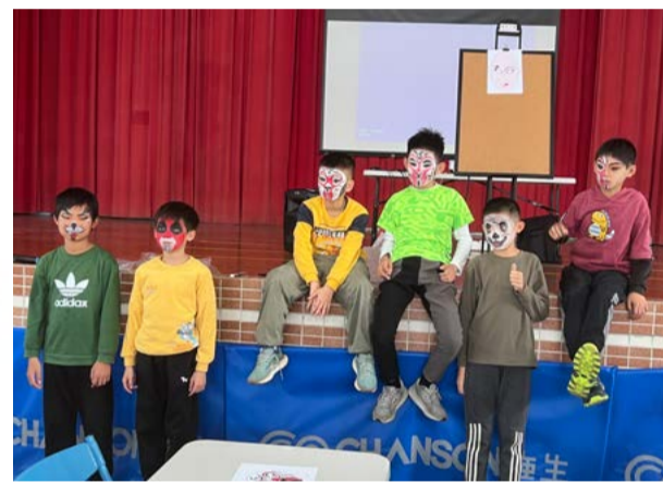
東安國小客家親子共學營

本次共學營以「語言傳承、文化扎根、親子共學」為核心，設計多元課程內容，包括戲曲基本功訓練（如拉筋、踢腿與走位）、客家小調與唱腔教學、角色扮演、戲服體驗，以及互動劇場與成果發表等。課程中強調「戲曲三功」（基本功、把子功、毯子功），讓學員在體驗中建立對戲曲藝術的初步認識與興趣。