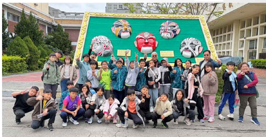
景美國小師生合影

此次參訪活動不僅讓遠在花蓮的景美國小學生近距離接觸傳統戲曲文化，也透過實際體驗培養學生對表演藝術的興趣與尊重。