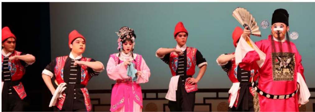
《春草闖堂》精彩片段