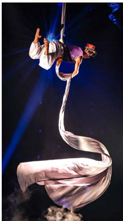
表演者 - 莊維安 - 2025 第十屆泰國國際高空大賽 (Airstars) 職業網吊組

學生時期便屢獲殊榮的莊維安，不僅精進高空皮吊，更發展出獨具特色的網吊創作。在 2025 年第十屆泰國國際高空大賽《Airstars》職業網吊組中，以迪士尼經典動畫《阿拉丁》為靈感，透過團方師長協助精確的結合服裝設計、神燈道具以及生動的肢體表現與高難度技巧，勇奪金牌，為臺灣特技在國際舞台上寫下新篇章。