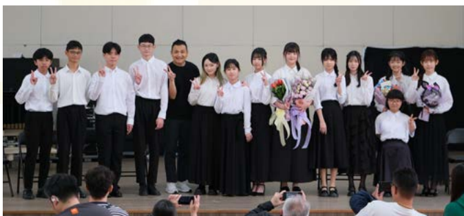
中三丙班導師與演出同學合照

音樂會後半段包含揚琴名曲《瑤山夜話》、改編作品《丟丟與他的銅仔》，以及動人心弦的《辛德勒的名單》。最後由全體同學大合奏久石讓經典作《菊次郎的夏天》，在輕快活潑的旋律中，為這場結合戲曲美學與現代風格的音樂盛會畫下圓滿句點。