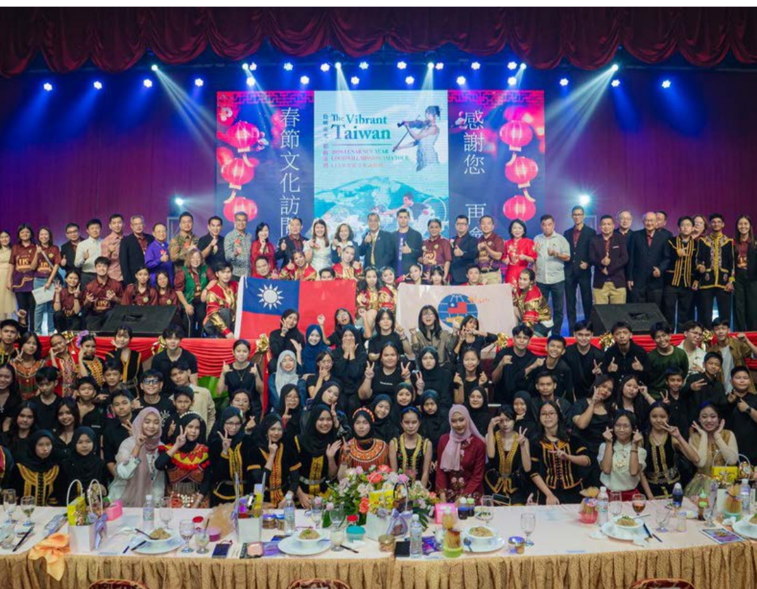
馬來西亞山打根千人欣賞後合影留念及中華聯合總會餐聚合影

文訪團於115年2月23日啟程至3月20日巡演訪問印尼、菲律賓、泰國、馬來西亞及日本等5國8座城市8場次的演出。從出發前的簽證辦理、機票與行李規劃、舞台技術需求確認，到與各國駐外單位、僑團及文化機構的密切聯繫，每一個細節都不容忽視。尤其本次巡演橫跨5國8座城市的演出，文化差異、語言溝通與當地行政流程各有不同，需提前反覆確認，確保每一場演出順利進行。