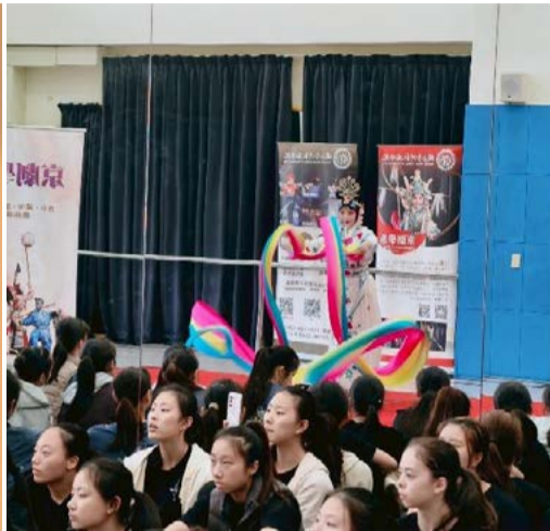
演出劇目：天女散花