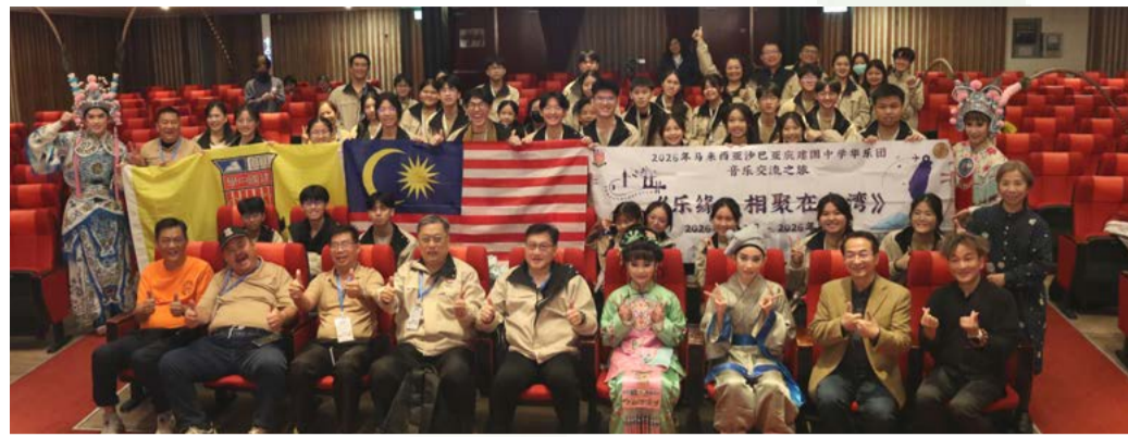
馬來西亞沙巴亞庇建國中學華樂團觀賞本校歌仔戲學系國高中部實習演出，學生從彩排時經二樓觀眾席就看得目不轉睛，表演中場休息時更興奮地與本校歌仔戲學系學生合照。

由於來訪人數眾多，此次參訪共分為三組路線參觀本校京劇文物館，該校學生們開心地與本館的互動裝置進行水袖試裝、拿鬚鬚與髯的相關道具進行試戴，並嘗試基礎的馬鞭表演技巧。家長們也聽著本校的發展歷史及京劇團團務來描繪臺灣表演藝術業界的情況。