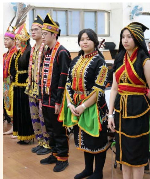
馬來西亞沙巴亞庇建國中學特別準備了馬來西亞當地民族的傳統服飾，並熱情介紹每一種服飾的特色。

參訪經過二樓時，所有學生都被歌仔戲學系實習演唱吸引而停下腳步，本校即講解觀賞歌仔戲等傳統戲曲和現代劇場不同，可以在亮相或是表演到一個斷點時拍手叫好。