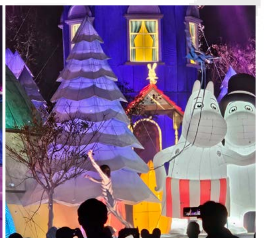
學生們在舞台上盡情地演出