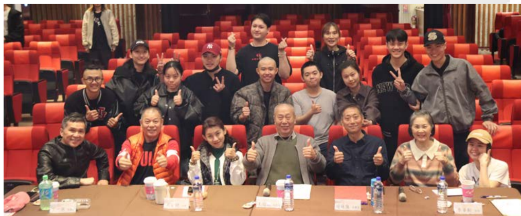
京獎比賽全體合影