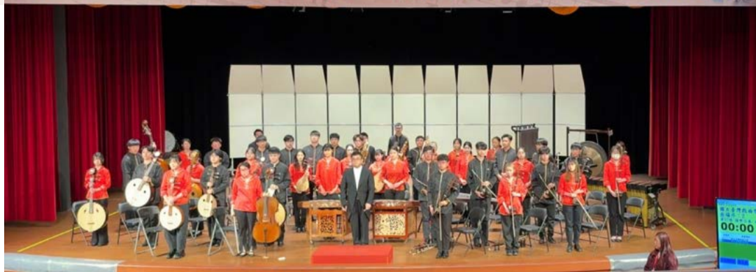
國樂合奏全體師生