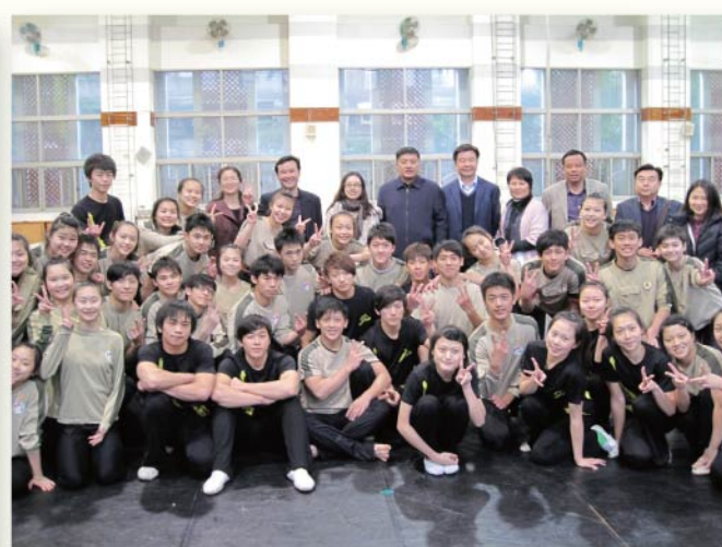
與民俗技藝學系師生合影