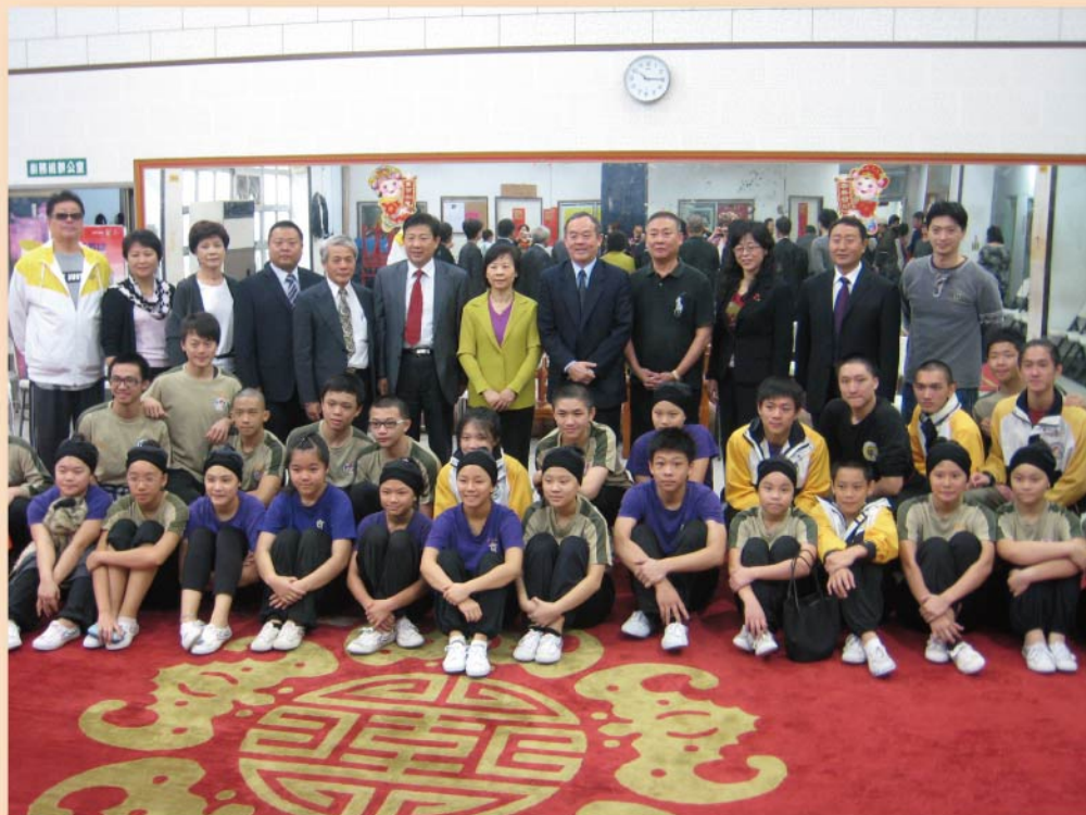
寧夏京劇團與本校京劇團交流後合影