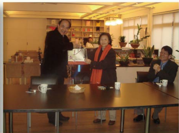
亞東技術學院徐校長澤志與本校游校長素鳳互贈禮物