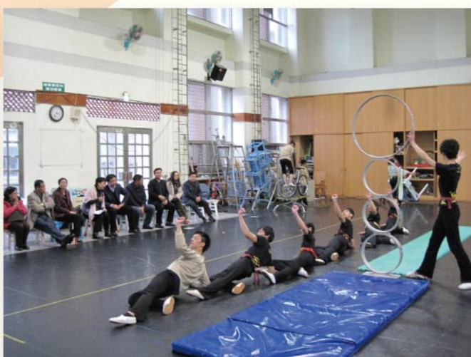
觀摩民俗技藝學系排練教學