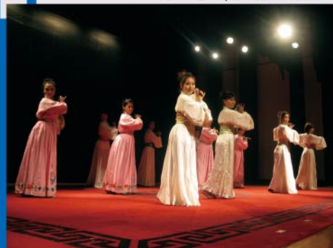
秀外慧中/水袖舞蹈表演