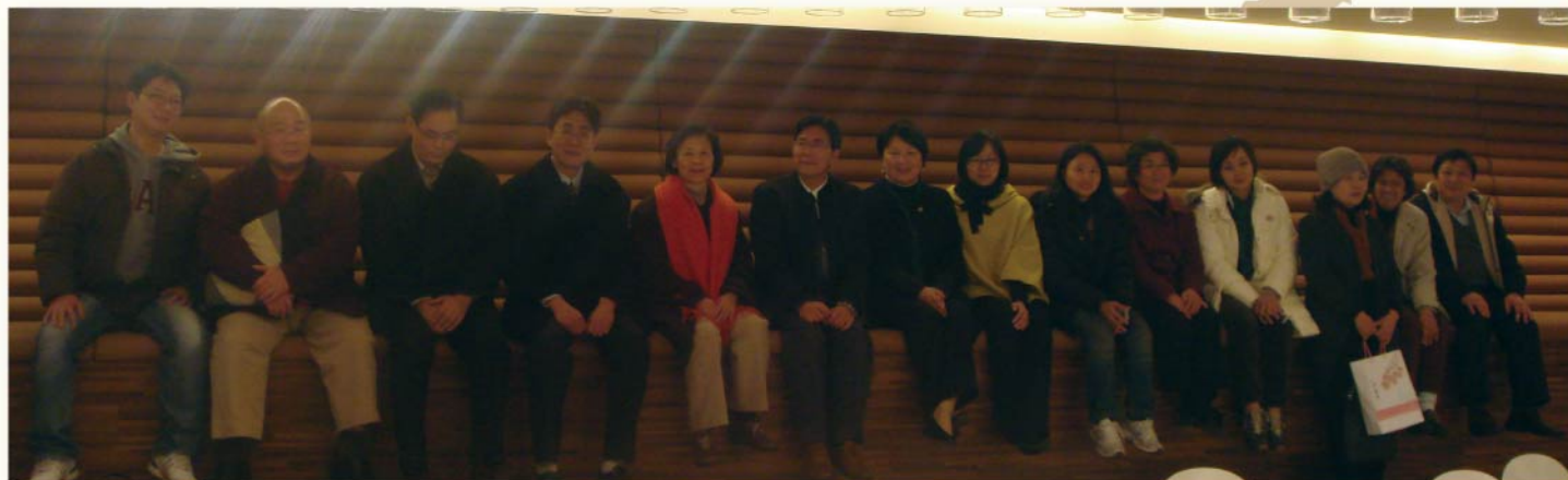
「標竿學習」研習獲一級單位主管及學院部教師支持

亞東技術學院圖書館是將「科技、人文、美」三者融合為一的智慧型圖書館，軟硬體設備現代化整體規劃、精心設計，明亮寬敞舒適，完全顛覆一般人對圖書館的刻板印象；館內藏書豐富多元，強調輕鬆學習特色，吸引青年學子走進圖書館親身體驗閱讀的樂趣，身歷其境才能感受到經營者的用心與苦心，此行收穫滿行囊，期為本校標竿學習達到預期的效益。