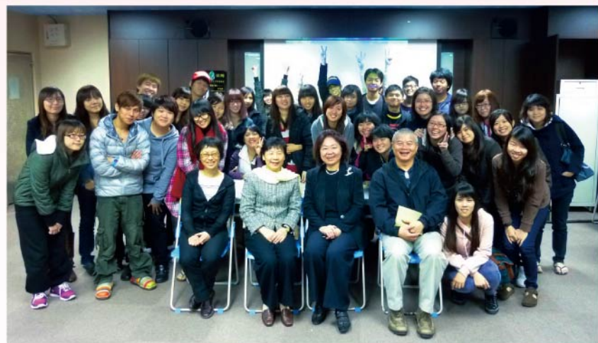
精采的講演結束也與音樂師生合影留念

多樣性自然生態之美 多變化歷史之美 多元化族群之美 多面向藝術之美 多元化生活之美 國際化科技之美