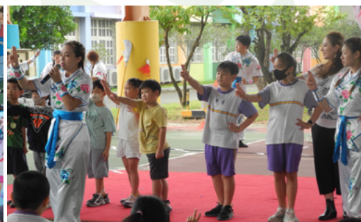
學東國小互動體驗