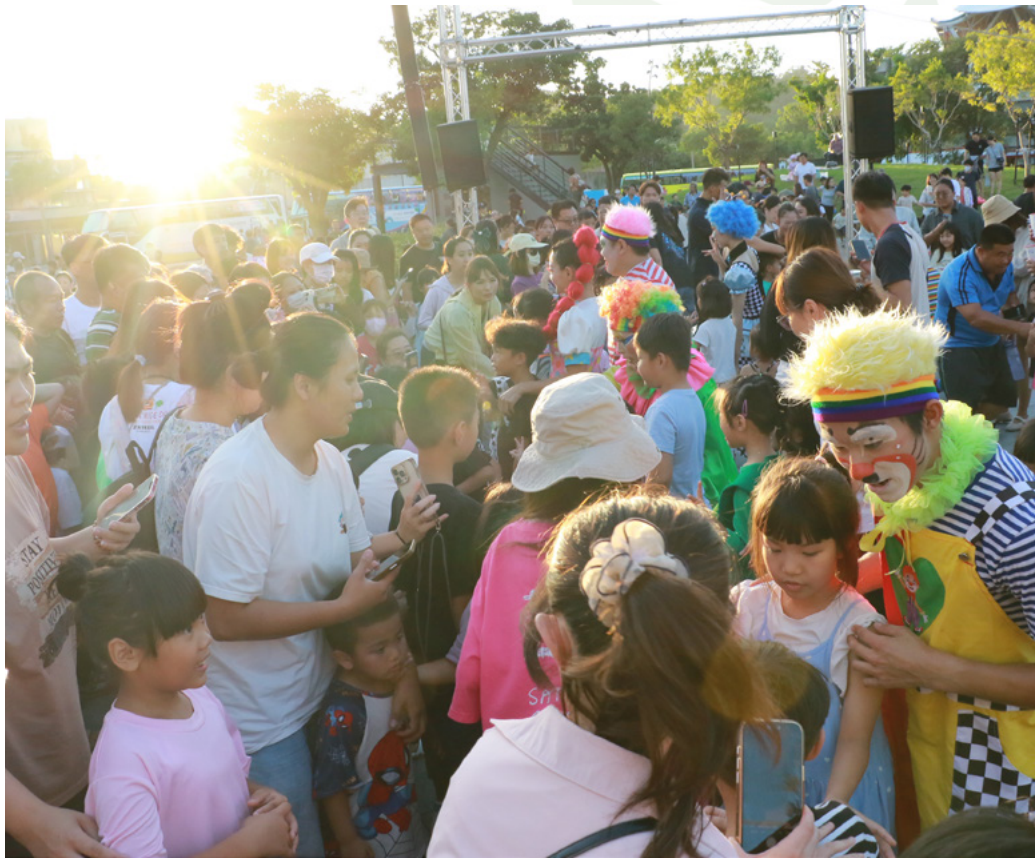
演出結束每位小朋友都相爭拍照合影

這場結合活化場域與互動體驗的盛會，成功讓表演藝術到偏鄉，成為民眾生活中共同的快樂記憶。