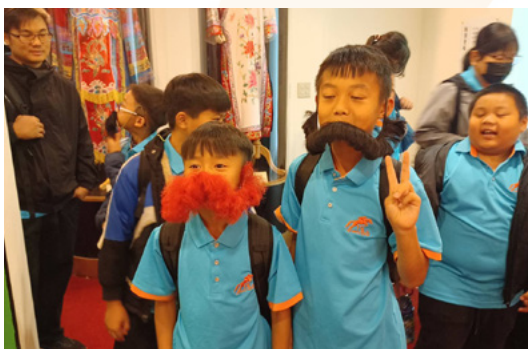
戲曲文物館參觀髯口體驗

上午行程安排觀賞民俗技藝學系高職部學生實習演出，演出內容展現紮實基本功與舞臺默契，特技翻滾、拋接與節奏變化引起現場熱烈掌聲，讓來訪師生近距離感受民俗技藝的專業訓練成果。中午時段，鎮瀾兒童家園師生與本校學生一同用餐，透過自然互動與交流，拉近彼此距離，也體會劇校同儕間溫暖的學習氛圍。