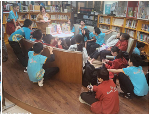
小六班參加班級共讀活動