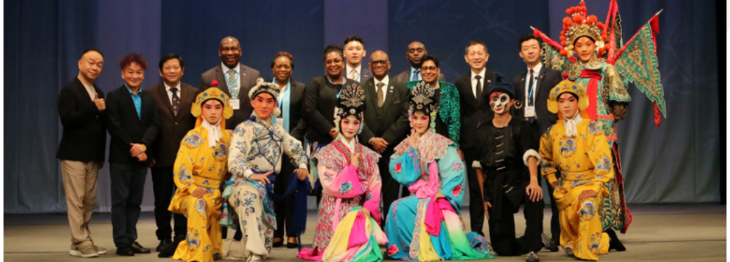
聖露西亞總督與大使代表團與本校教務長、研發長、京劇團團長及演員們

透過本次參訪，本校成功展現臺灣傳統表演藝術的教育成果、提升我國文化軟實力，深化與友邦外交關係。同時也促進京劇團師生國際視野，激勵學生專業認同及自信心，未來本校將持續推動國際藝文交流合作，發揚臺灣傳統戲曲。