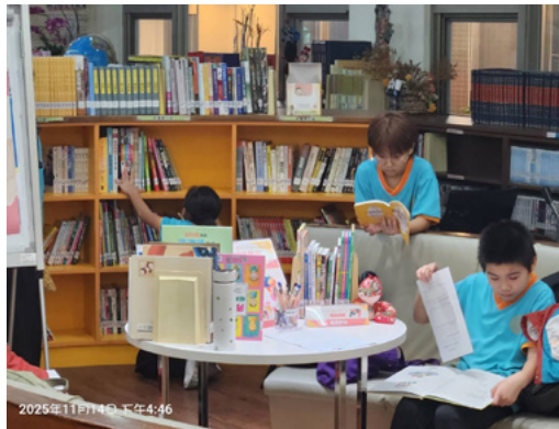
小五班參加班級共讀活動

圖書館本學期與國小部教師合作舉辦「性別平等與霸凌防制主題班級共讀活動」，引導學生透過閱讀關注社會議題。活動中，老師帶領學生閱讀相關書籍，並結合提問，使學生思考性別平等與面對霸凌的正確態度。透過閱讀學習單書寫心得，提升閱讀能力，培養同理心和展現圖書館在閱讀推廣與價值教育上的多元角色。