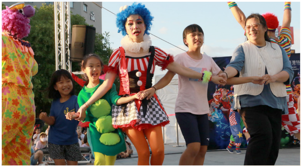
在互動大朋友小朋友都踴躍參與

為使藝術更貼近在地生活，本次「馬戲派對」特別選址於承載臺東人兒時記憶的「臺東舊站新生廣場」。在節目融合高難度倒立、呼拉圈、雜耍、平衡技及趣味劇場元素，透過專業技巧與生動敘事，將特技轉化為跨越年齡的共感語言。演出不僅展現團隊合作與勇於挑戰的精神，更發揮了特技舒緩壓力、開懷大笑的療癒功能。