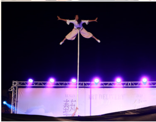
乘風破浪 - 演員柯予曦