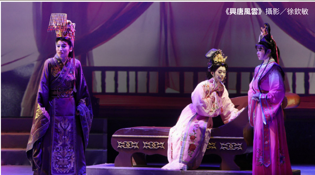
《興唐風雲》