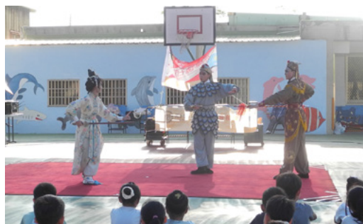
鎮海國小演出《盜仙草》