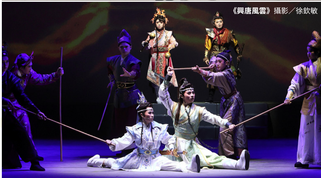
《興唐風雲》