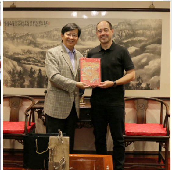
本校校長與德國中學校長合影，本校致贈祈求吉祥的龍年年曆，而德國中學校長致贈圖片裡桌上的藝術品，傳達教育能拉拔學生向上發展的意涵。