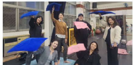
韓國貴賓與本系教師體驗交流

Circostrada 是歐洲當代馬戲和戶外藝術的主要網路。自 2003 年以來，這個網路已經聚集了來自 45 個國家的 170 多名成員，致力於支援這些藝術領域的發展、可見度和國際化。