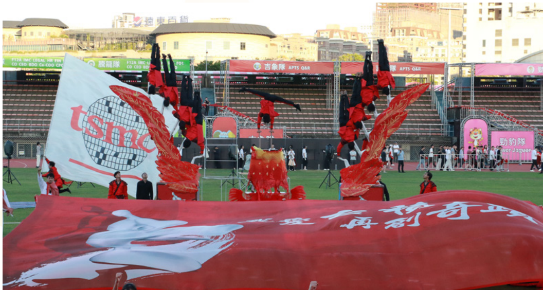
鳳凰展翅再創奇蹟

這場結合在地文化藝術與尖端科技情誼的盛會，不僅展現台積電邁向全球舞台的凝聚力，也在黃仁勳旋風的加持下，為 114 年半導體產業揭開最激昂、最令人期待的序章。