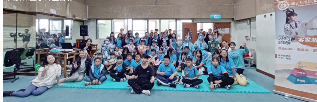
與獅潭國小師生合影