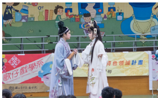
海東國小演出《遊湖借傘》