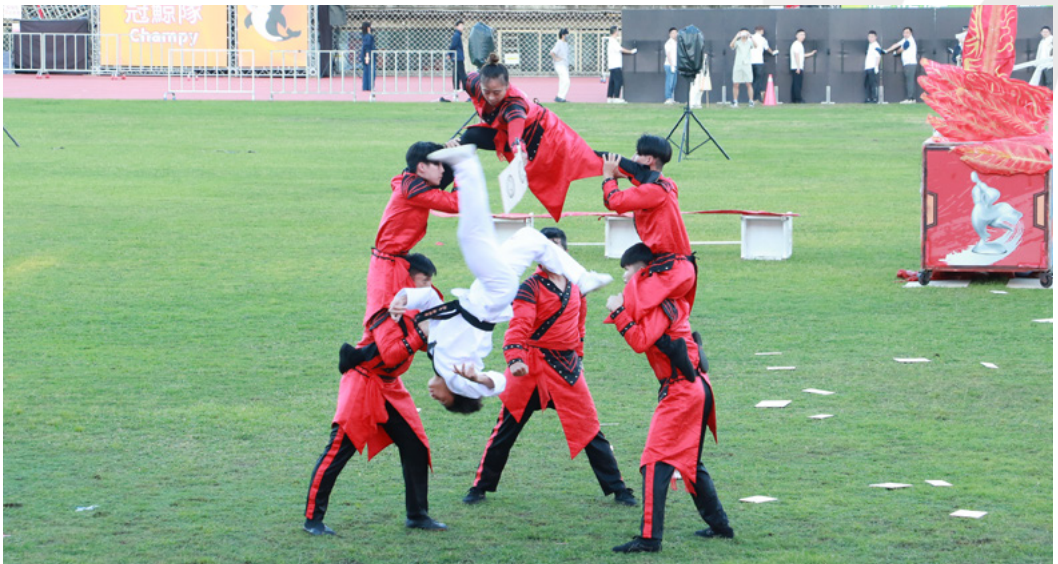
跨界合作提升跆拳道與特技難度