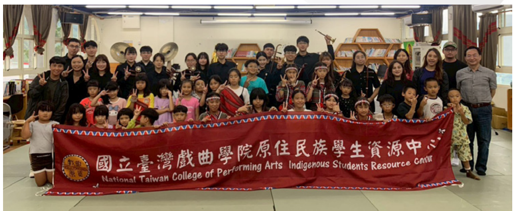
戲曲音樂學系與南山國小師生合照

為期兩天的部落之行在各方支持下圓滿落幕。此次活動不僅豐富了戲曲音樂系學生的文化視野，更在彼此的交流過程中，看見了藝術薪傳的無限可能。