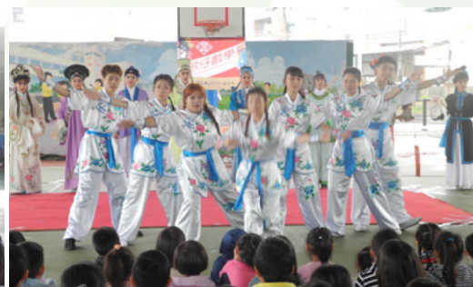
顯宮國小武功展演