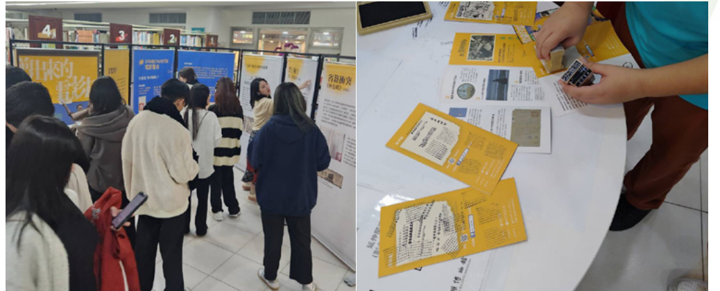
行動展覽－戰後電影審查特展，老師於課堂上帶領同學前來觀展，並解說展板內容。

圖書館與國家人權博物館合作舉辦「言論自由日特展（三）：戰後電影審查特展」行動展覽，透過圖文展板，將戰後電影審查歷史帶入校園。展覽介紹不同時期的審查制度與案例，呈現電影創作在制度限制下所面臨的挑戰，並說明導演如何透過調整劇情、台詞或象徵手法，爭取作品上映的可能。此外，也探討語言政策對電影產業的影響，如台語電影在資源受限下的發展困境。