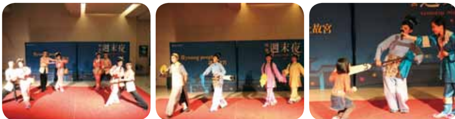
三腳採茶戲《上山採茶》一眾兄弟與眾姊妹相互褒貶後，一同合著歌舞採茶囉

師長的帶領與細心照料協助，讓我們沒有後顧之憂，能夠全力以赴，不僅演出，也包辦後台音響、字幕、服裝、道具的所有事務，加上口條甚好、活潑可愛的主持人，我們看到自己的無限潛能。