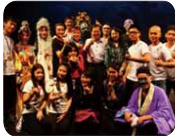
演出結束後高三學生與校長和副校長兼系主任一起合照