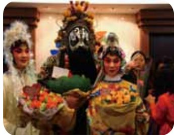
高三同學的和拍照片