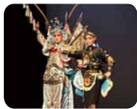
火燒裴元慶：劉尚炫飾演