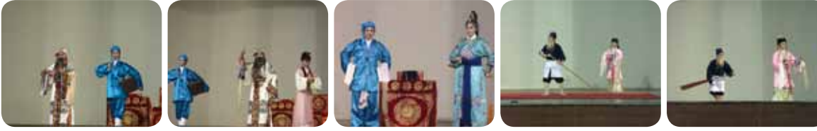
《八仙鬧海》之呂洞賓與童子至凡間尋找白牡丹。