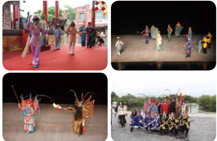
左上本系高中部於宜蘭傳藝中心演出前戶外踩街表演