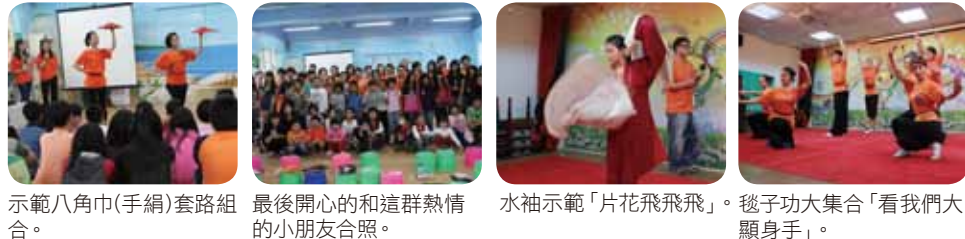
示範八角巾(手絹)套路組合。