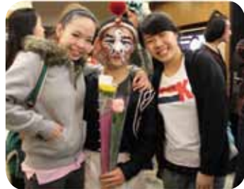
歡樂場景(三位是姐弟也都是京劇學系的學生)