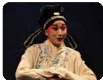
憶十八：梁山伯/王佩宣飾演

本校一年一度的畢業季由本學系打頭陣，演出分為兩階段演出，4月26、27日為第一階段演出、5月4、5日為第二階段，八年的學習成果將在此演出過程中劃下一個完美的句點。