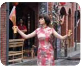
演出前30分戶外踩街活動：高 敲鑼打鼓吸引人潮進劇場演 現場即興表演翻滾