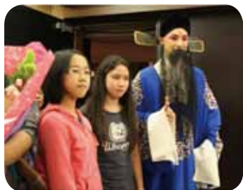
高三學長與學妹的合影