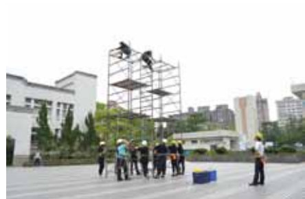
Unity is strength